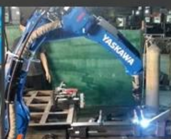
03 Robot system