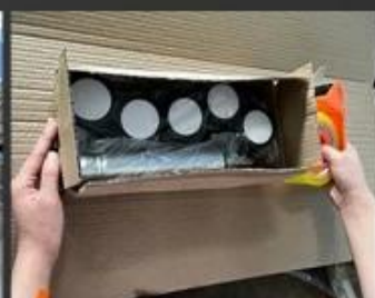
11 Fitting packing