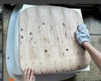
04 Foam sticking