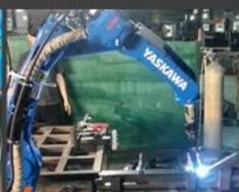
03 Robot system