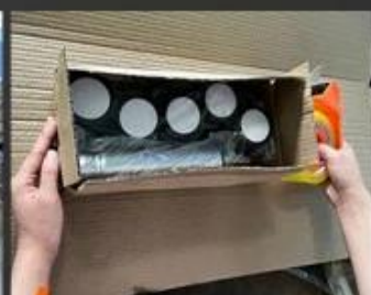
11 Fitting packing