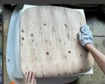
04 Foam sticking