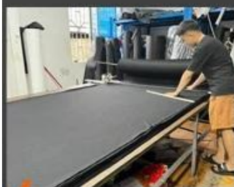
05 Fabric cutting