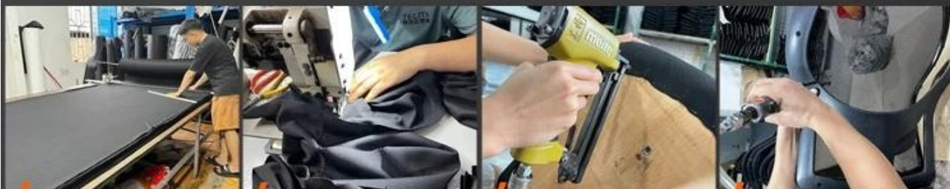
05 Fabric cutting